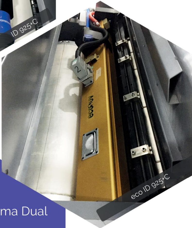
eco ID 925+C