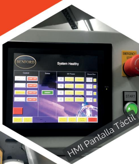
HMI Pantalla Táctil